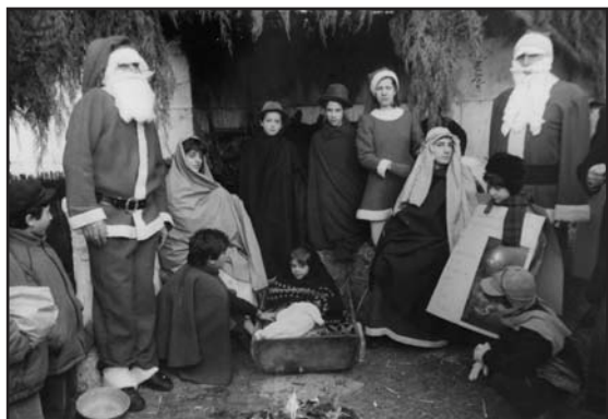
Il primo ed unico presepio vivente in Piazza Treccani organizzato dall'Eco.