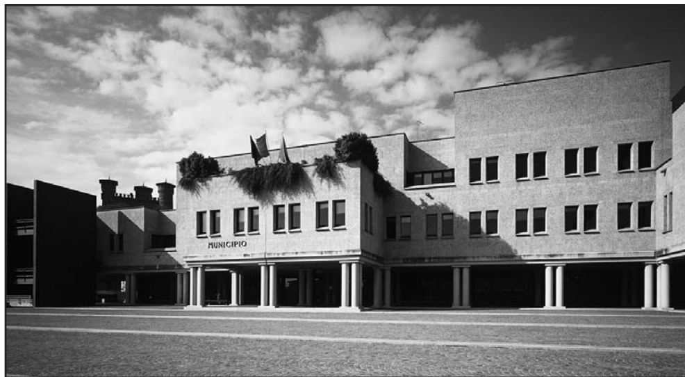
Il nuovo palazzo municipale di Montichiari, costruito nei primi anni '90 (1991-1995) sull'area del vecchio mercato bestiame. La prestigiosa opera, inaugurata il 12 maggio del 1996, ebbe un costo di 12 miliardi di lire, comprensivo della piazza e del parcheggio sotterraneo. La scritta "MUNICIPIO" richiama quella che appariva sulla facciata di Palazzo Tabarino, sede del vecchio municipio fino alla primavera del 1996. Il trasloco nella nuova sede rappresentò un evento che vide protagonisti coinvolti tutti i dipendenti comunali, giustamente orgogliosi di trasferirsi in nuovi spazi più funzionali. Ma del vecchio municipio restava nel cuore di tutti una particolare nostalgia, perché là erano cresciuti e là era maturata la loro professionalità e l'amore per il proprio lavoro.

pendenti comunali. È quindi a loro che ancora desidero esprimere in particolare la mia personale riconoscenza e quella di tanti cittadini che sanno apprezzare il ruolo fondamentale e insostituibile del dipendente