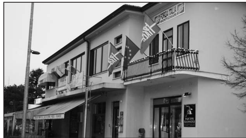
La nuova sede di F.I. in via Marconi.

Una scaletta di incontri, da gennaio a maggio, con una serie di argomenti per analizzare le richieste del territorio, così come verranno proposti convegni ispirati al concetto della sussidiarietà.