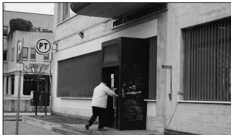
L'entrata del nuovo ufficio postale di Montichiari presso la City.